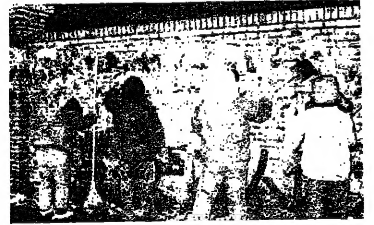
حائظ الديمقراطية في بكين

ولا يزال الزعيم هو كونينغ يحتل منصب رئيس الوزراء والقائد العام للجيش ، ولكن من المتوقع ان يتم تجريده من المنصب الاول في فترة قريبة .. ويبدو ان دينغ يريد زوا